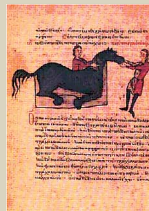
Hippiatrica. determinación de la edad de un caballo.

En relación con esta cuestión, SEVILLA, citado por LECLAINCHE, dice: "Bajo la pluma de Apsirto renacen los métodos terapéuticos de los sármatas, las costumbres de los habitantes de Capadocia, y de Siria; bajo la de Theom-