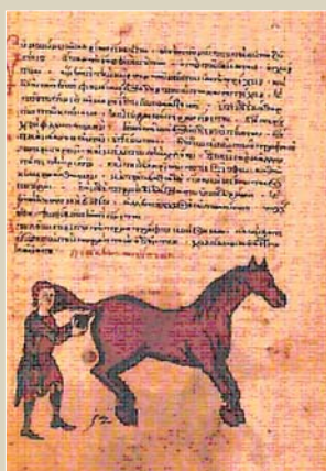
Hippiátrika. tratamiento del prolapso rectal

APSIRTO o APSYRTUS.- Nació hacia el año 300, en la pequeña población de Clazomene, situada en la costa oeste de Asia Menor y patria de Anaxágoras; pero pasó la mayor parte de su vida en Prusa (actual Brussa turca) y en Nicomedia, residencia del emperador Diocleciano. En su juventud recibió una buena educación médica, posiblemente en la Escuela de Alejandría; pero durante toda su vida,